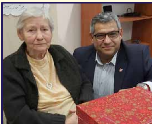
Mikuláš v Domove dôchodcov Sládkovičovo

Rôznorodé informácie, nedôvera a neistota ovplyvnila a rozdelila celú spoločnosť. Zatiaľ čo jedni dodržiavali všetky nariadenia a boli