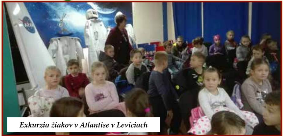
Exkurzia žiakov v Atlantise v Leviciach