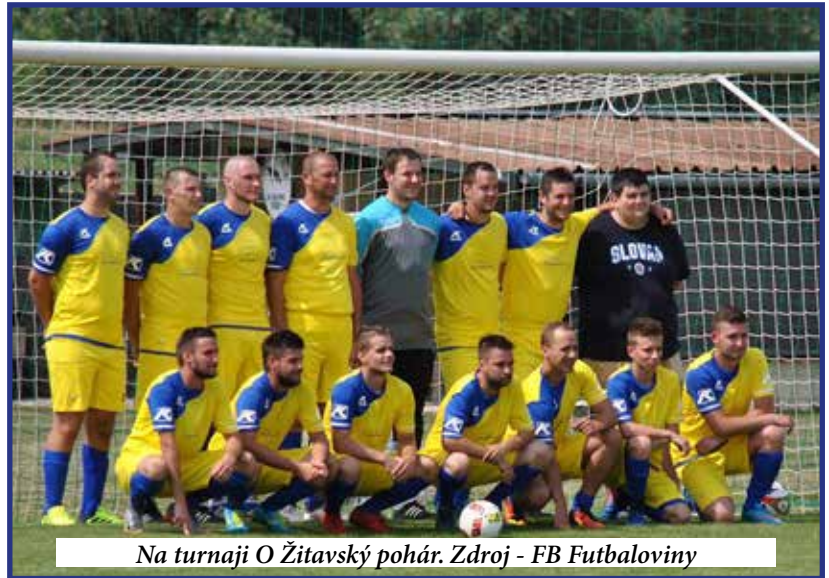
Na turnaji O Žitavský pohár.