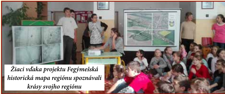
Žiaci vďaka projektu Fegýmešská historická mapa regiónu spoznávajú krásy svojho regiónu