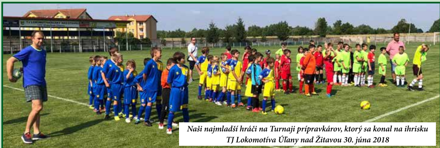
Naši najmladší hráči na Turnaji prípravkárov, ktorý sa konal na ihrisku TJ Lokomotíva Úľany nad Žitavou 30. júna 2018

- Tým, že veľa hráčov odišlo a ešte viac prišlo, bolo potrebné každému nájsť post, na ktorom by hrával a bol platný pre mužstvo. Doba na prípravu tak bola krátka, ako i zohranie mužstva, pretože niektorí hráči prichádzali až počas rozbehnutej sezóny. Prípravné zápasy sa preto vôbec nevyvíjali podľa našich predstáv. Kondícia bola slabá, čo sme pocítovali hlavne v druhom polčase, a kvôli tomu sme aj niektoré zápasy prehrali. S postupným plynutím sezóny sa však naše výkony zlepšovali. Tréningová účasť bola taktiež celkom dobrá, aj keď by som bol rád, keby na ne chodilo viac hráčov zo základnej zostavy. Avšak