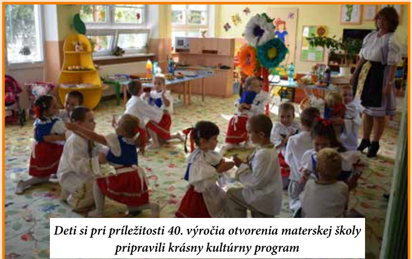
Deti si pri príležitosti 40. výročia otvorenia materskej školy pripravili krásny kultúrny program