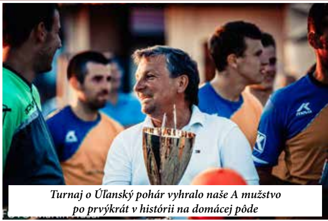
Turnaj o Úľanský pohár vyhralo naše A mužstvo po prvýkrát v histórii na domácej pôde

V Úľanoch nad Žitavou organizátori z domácej TJ pripravili „turnaj 2 v 1“. V nedeľu 23. júla sa tu totiž uskutočnil 30.