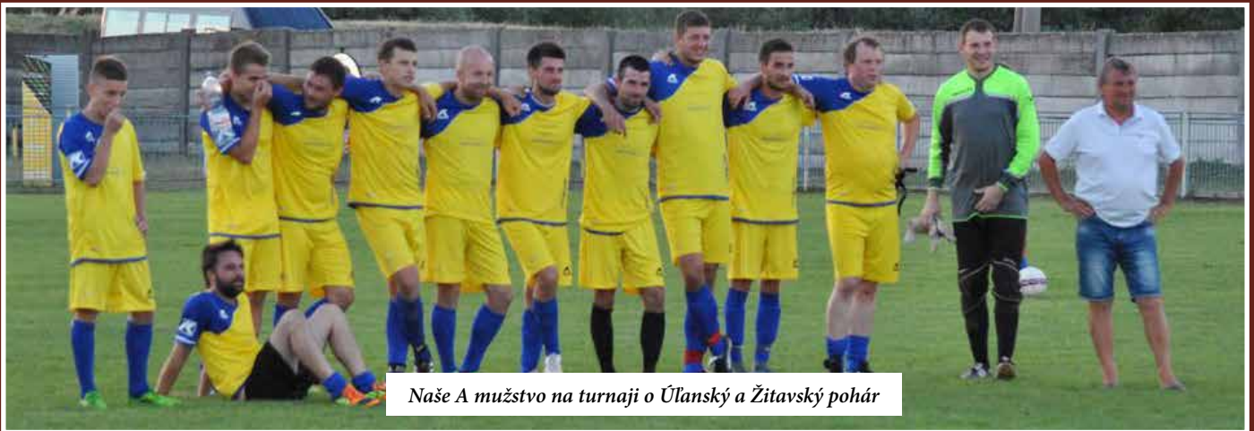
Naše A mužstvo na turnaji o Úľanský a Žitavský pohár