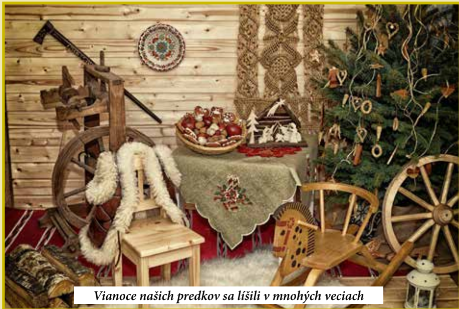
Vianoce našich predkov sa líšili v mnohých veciach

Štedrý deň - už samotný názov vypovedá o tom, že ľudia by v tento deň mali mať pocit hojnosti. Preto na štedrovečernom stole bývali jablká, orechy, oblátky s medom, makové pupáky a rôzne omáčky, zriedka ryby. Pod stolom bol zväzok slamy z maštale ako spomienka na Ježiška, ktorý sa narodil na slame. Najskôr sa ľudia pomodlili, potom gazda rozhodil orechy do všetkých štyroch kútov so slovami: „Moje milé štyri kúty, nemám vás čím obdariti,