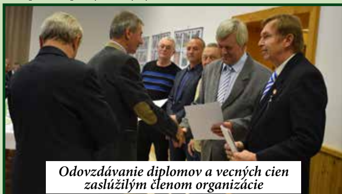
Odvzdávanie diplomov a vecných cien zaslúžilým členom organizácie