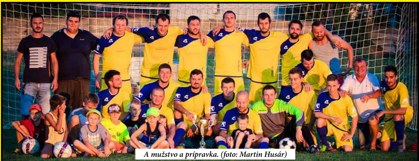
A mužstvo a prípravka.