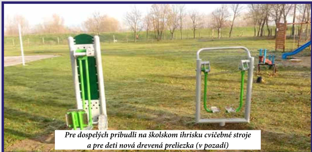
Pre dospelých pribudli na školskom ihrisku cvičebné stroje a pre deti nová drevená preliezka (v pozadí)

pomôcok. Obec oslovila projektanta, navrhli sa riešenia, ako by to mohlo byť a poslanci obecného zastupiteľstva stacionár neschválili. Vôbec nebrali do úvahy návrh projektanta. Dôvodom bolo, že to vedeli neskoro, no my sme to prvý polrok pripravovali len projekčne, šetřili sme na to peniaze, jednali sme s agentúrou, ktorá by to celé zabezpečila, pretože ak chceme predkladať nejaký zámer na schválenie, ten sa môže