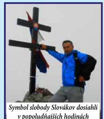
Symbol slobody Slovákov dosiahli v popoludňajších hodinách