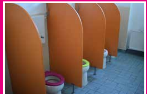
Obecný úrad kúpil do MŠ nové sociálne zariadenia

- Radi by sme deťom vymenili koberce v triedach, ale to by sme riešili cez občianske združenie