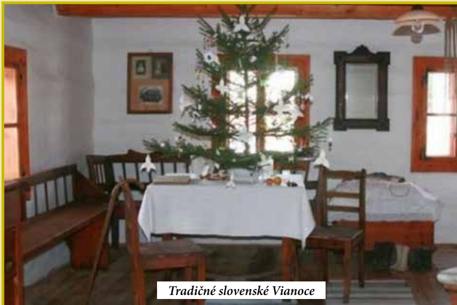
Tradičné slovenské Vianoce

Prežime i tento slávnostný vianočný čas v radosti a pokoji a pokúsme sa urobiť ho slávnostným aj pre tých, ktorí sú okolo nás. Naučme sa tešiť sa zo života a nezabúdať pritom na to, že skutočná radosť pramení v Bohu. Buďme preto pripravení prijať v prvom rade Jeho. A až potom darčeky... Len takto totiž precítime skutočné čaro Vianoc.