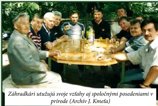
Záhradkári utužujú svoje vzťahy aj spoločnými posedeniami v prírode