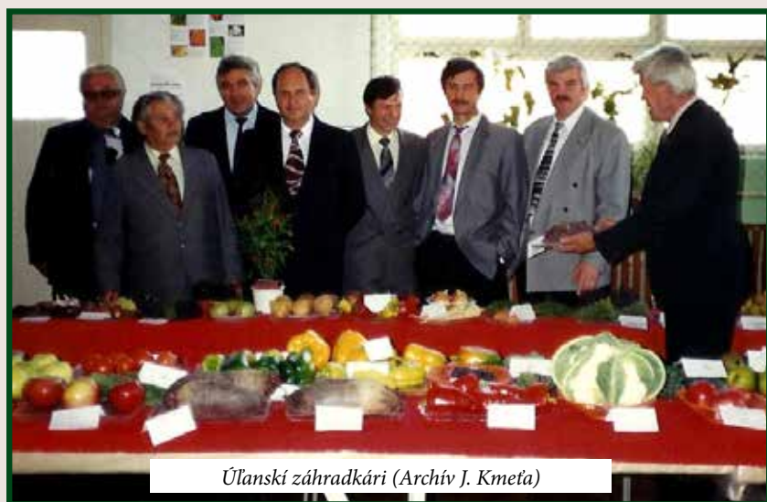
Úľanskí záhradkári