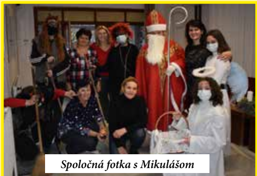
Spoločná fotka s Mikulášom