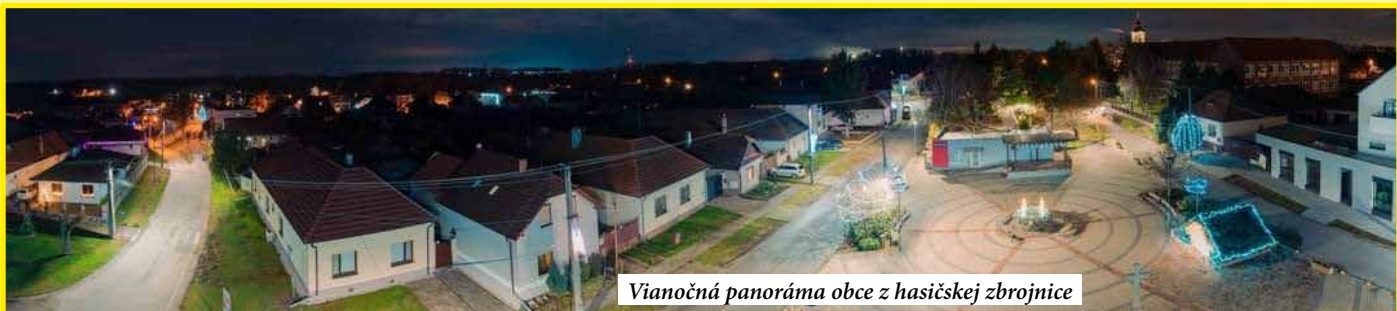
Vianočná panoráma obce z hasičskej zbrojnice