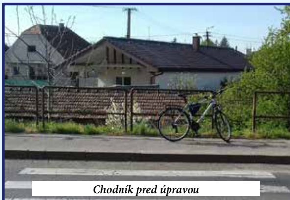
Chodník pred úpravou