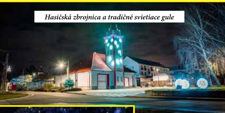
Hasičská zbrojnica a tradičné svietiace gule