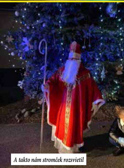
A takto nám stromček rozsvietil