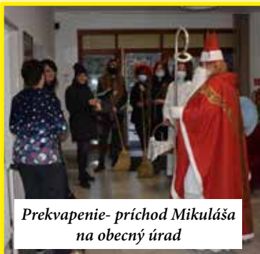
Prekvapenie- príchod Mikuláša na obecný úrad