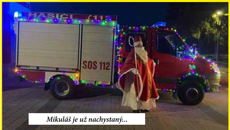
Mikuláš je už nachystaný...