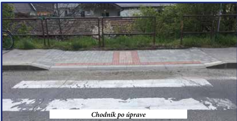
Chodník po úprave