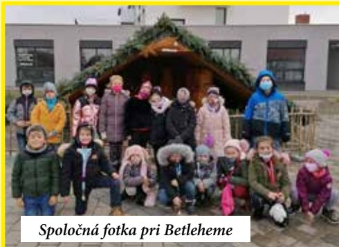
Spoločná fotka pri Betleheme