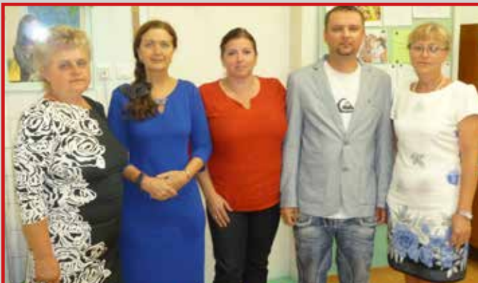
Kolektív základnej školy: