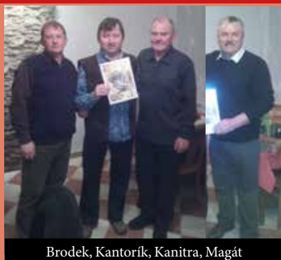
Brodek, Kantorík, Kanitra, Magát