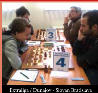
Extraliga / Dunajov - Slovan Bratislava