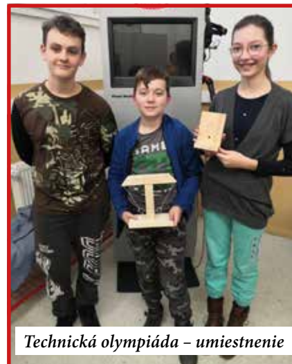
Technická olympiáda – umiestnenie

Áno, žiaci sa napríklad zúčastnili svetovej výstavy Cosmos Discovery Tajomstvá vesmíru, hviezd a galaxií v Bratislave. Množstvo zaujímavostí o najdôležitejšej časti ľudského tela, čo je to hlava deravá, na čo nám slúžia zmyslové orgány, koľko váži mozog alebo aké je to mať chrobáka v hlave,