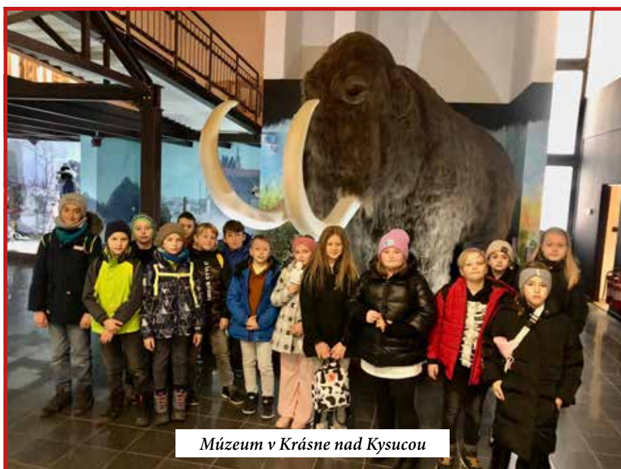
Múzeum v Krásne nad Kysucou

Je to pravda, čarovalo sa, nie však kúzľami a elixírmi, ale fantáziou, nápadmi a najmä šikovnými a tvorivými rukami našich žiakov. Tí počas celého týždňa vyrábali jesenné dekorácie z ovocia, zeleniny a prírodných materiálov. Vdýchli im podobu zvieratiek, postáv či vecí a tieto krásne výrobky prezentovali na výstave v sále obecného úradu. Jesenné prázdniny sme potom v našej škole privítali veselým podujatím Remeslo má zlaté dno. Priestory školy sa premenili na stánky ľudových remesiel s tradičnými domácimi výrobkami. Nechýbali stánky s kváskovými chlebíkmi a domácimi nátierkami, včelárstvo a výrobky z medu, ručne pletené výrobky z vlny a kože. Deti tak mohli nazrieť do tajomstiev procesu výroby drotárskych výrobkov, sviečok, oblátok či štrikovania. Sme veľmi radi, že na podujatie prijali pozvanie aj babičky zo Senionu, ktoré predviedli našim žiakom rôzne techniky domácich ručných prác. Podujatie sa nieslo vo veselej atmosfére plnej ľudovej hudby a spevu. V programe vystúpil folklórny súbor Dúbravanka, ktorý sprevádzal podujatie počas celého