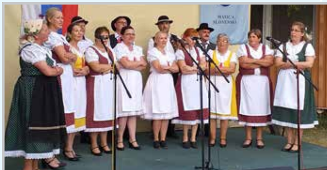
Spevácka skupina Nádej - VATRA júl 2019 DMS v Galante