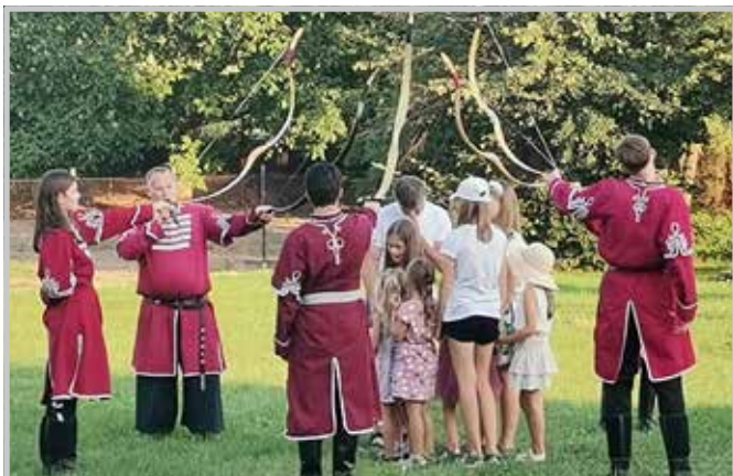
Oslava sv. Štefana kráľa, Csemadok Košúty, Csenkey baranta