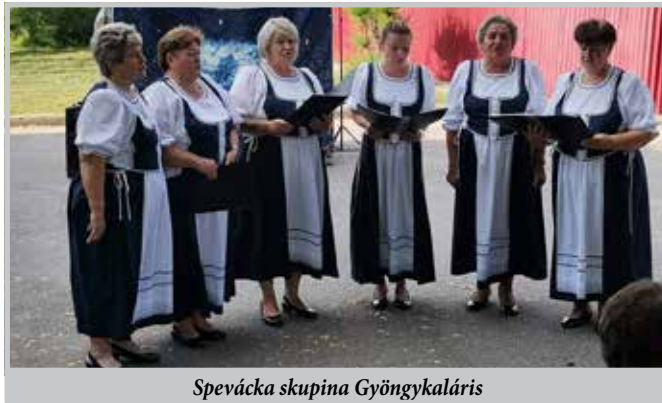
Spevácka skupina Gyöngykaláris