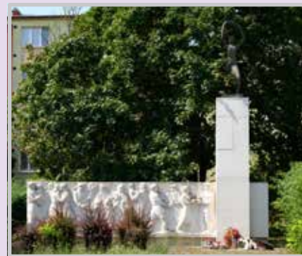
Pomník SNP v Šali bol postavený z vračanského vápenca. Jeho poškodenie spôsobili predovšetkým vandali, vtáčto a poveternostné vplyvy.

text: Alžbeta Tóthová, foto: TASR - Henrich Mišovič