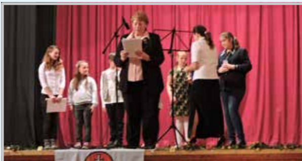
Večer jubilej 2015